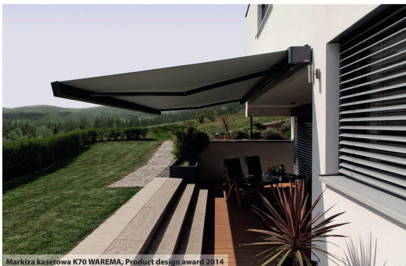
Markiza kasetowa K70 WAREMA, Product design award 2014