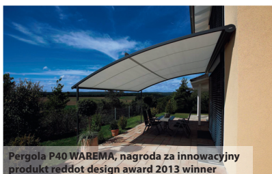
Pergola P40 WAREMA, nagroda za innowacyjny produkt reddot design award 2013 winner