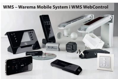
WMS – Warema Mobile System i WMS WebControl